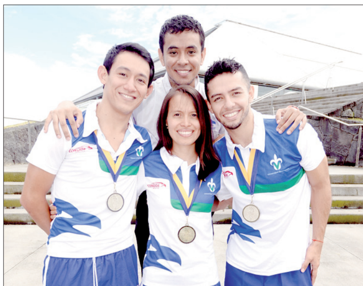
Integrantes del equipo de Gimnasia Aeróbica

Veracruzano de Voleibol y recién participamos en un evento celebrado en Córdoba, donde obtuvimos los mejores lugares, ello nos permite un fogueo que logra una mejor formación de los jóvenes en este camino del voleibol”.