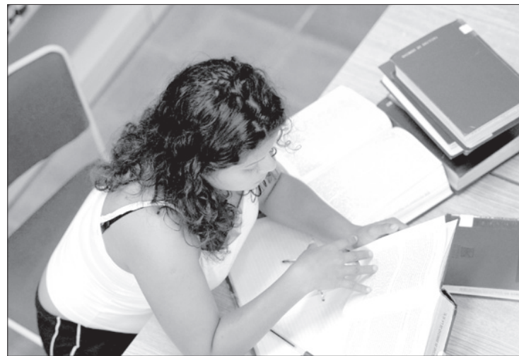
Ofrecen alrededor de 20 mil servicios por semestre

“Si algún libro es muy solicitado y no se encuentra en la biblioteca, puede pedirse a alguna de las 56 bibliotecas que integran el sistema y se hace el préstamo por 25 días.”