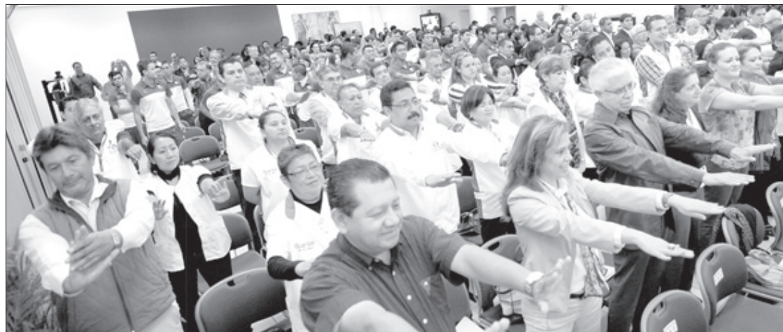
La asistentes realizaron ejercicios de gimnasia laboral