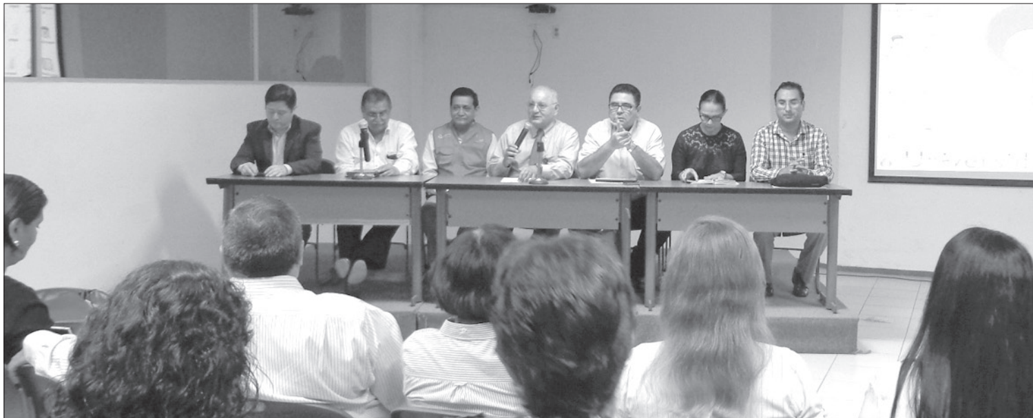
Funcionarios de la UV y Sesver subrayaron la importancia de la prevención