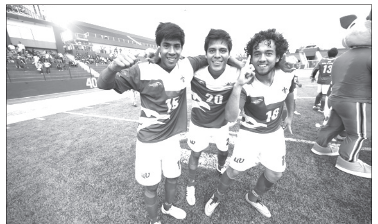
Los medallistas en la Universiada Nacional 2015 quieren ser protagonistas