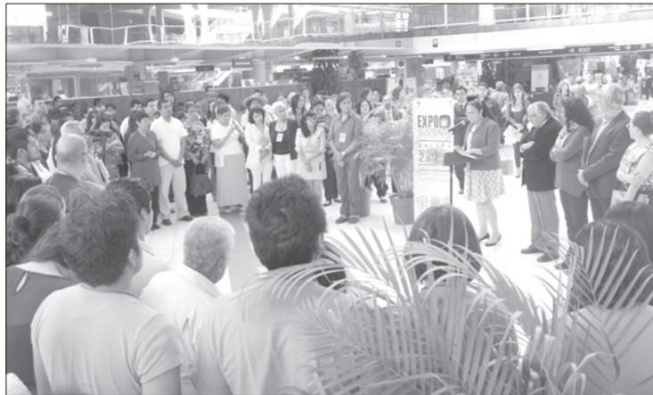
La Rectora inauguró la Expo Sustenta 2015

Dicho programa –que norma el quehacer cotidiano