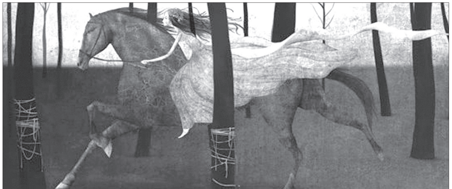
El dossier gráfico corrió a cargo de Gabriel Pacheco