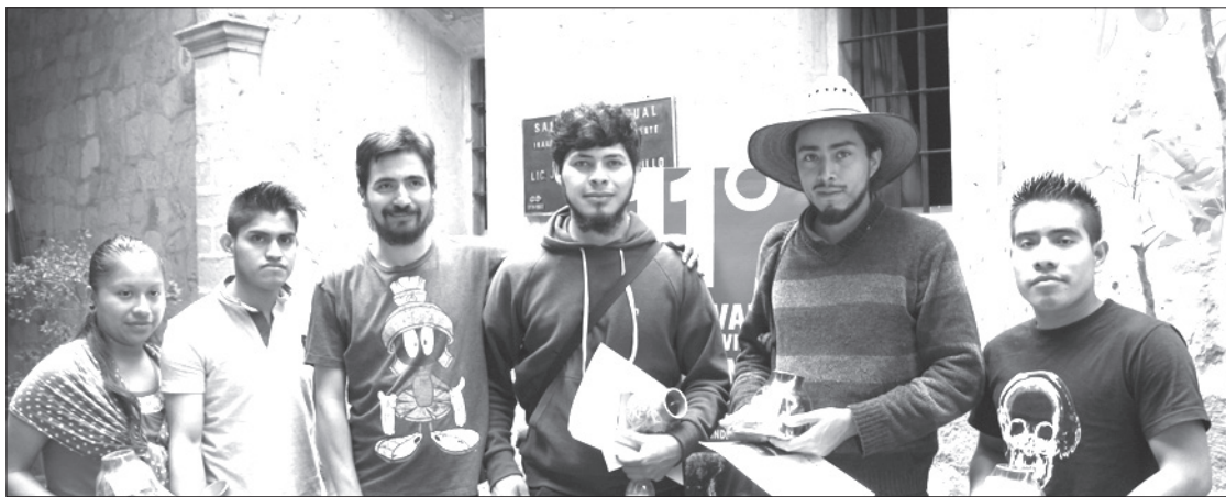
Equipo que intervino en el documental Xatapaxaw Tiyat

Por su parte, el equipo de producción de Xatapaxaw Tiyat trabaja en nuevos proyectos documentales. Uno de ellos, sobre la danza del Matalachín, se realiza en Espinal y otras comunidades de la región. Otro más aborda el tema de la migración en la sierra alta del Totonacapan.