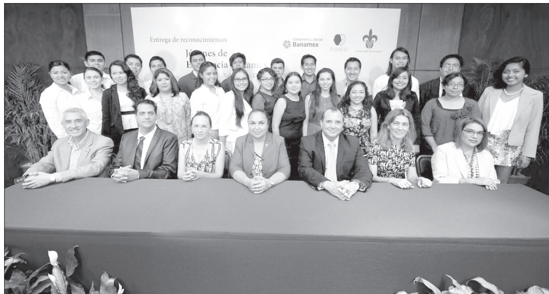
Estudiantes beneficiados acompañados de funcionarios universitarios y de la banca