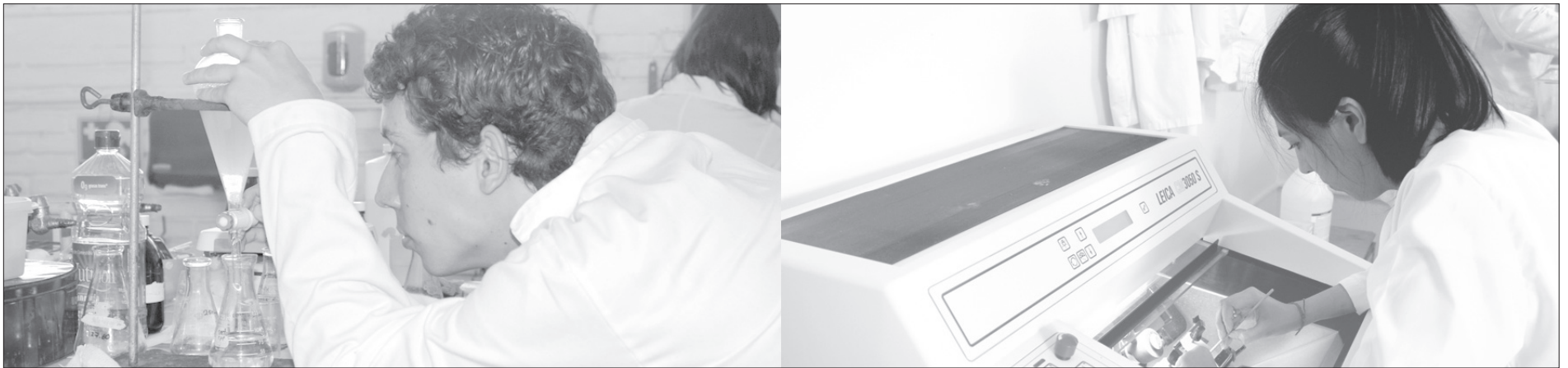
La Facultad forma profesionistas de alto nivel