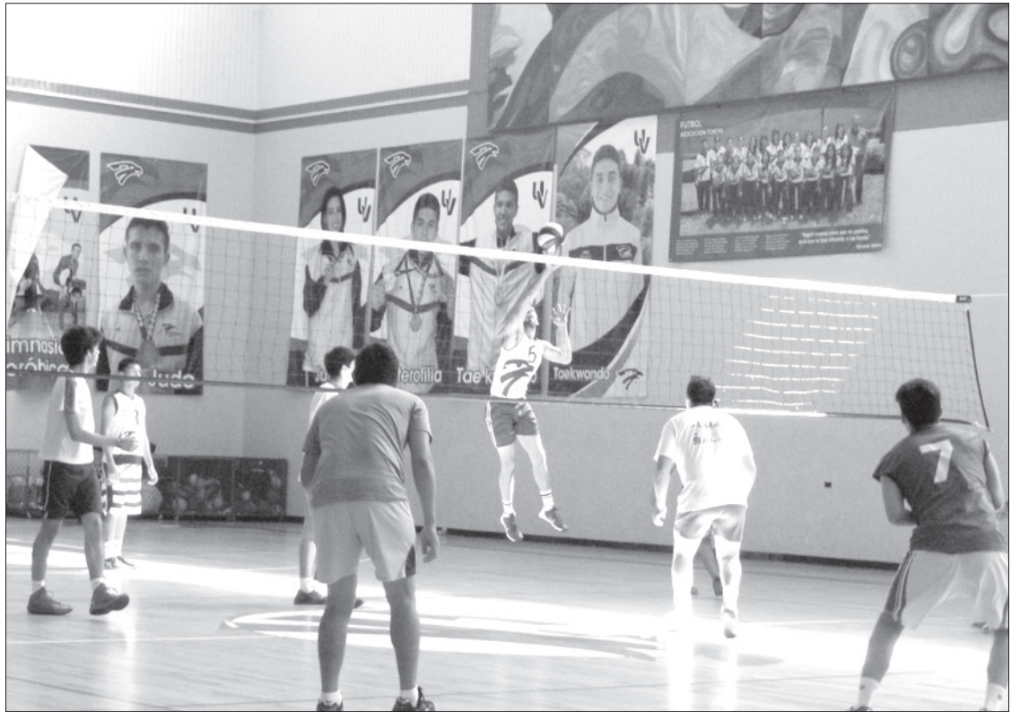
En la rama varonil participan ocho representativos

Para el viernes 4 de septiembre sólo hay un duelo, a las 17:00 horas, Psicología contra FIEMCAB (varonil).