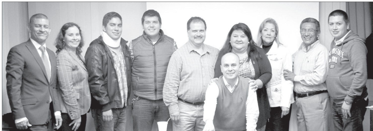
Los comisionados refirieron propuestas para enfrentar la situación financiera

Representantes alumnos, académicos y autoridades que conforman la Comisión, consideran necesario generar nuevos proyectos que permitan conseguir recursos adicionales