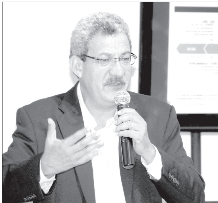
El académico habló sobre la Reforma Energética