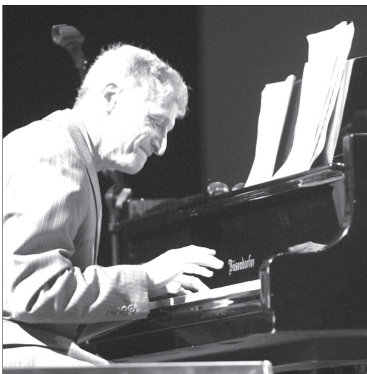
Las ediciones anteriores han presentado a grandes exponentes del género

Enfatizó la presencia del trío de Albert “Tootie” Heath y el grupo de Orlando “Maraca” Valle y sus Latin Allstars, con Giovanni Hidalgo, Steve Turre y Horacio “El Negro” Hernández entre sus integrantes.