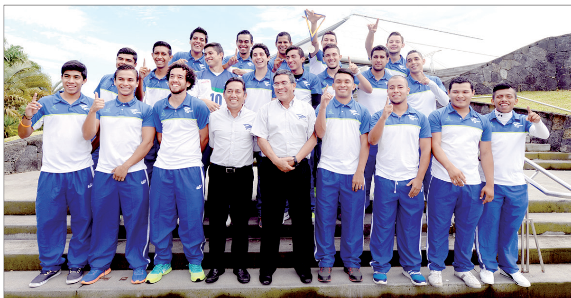
Selección de Fútbol Soccer