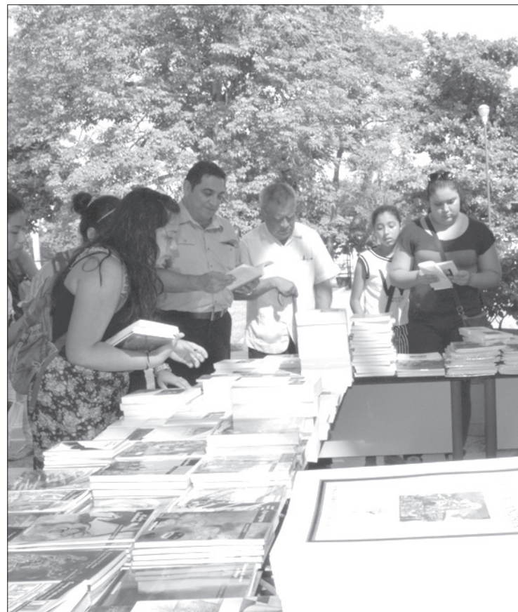
Estudiantes y público en general abarrotaron los módulos de venta

En la Facultad de Ciencias Biológicas y Agropecuarias desde temprana hora se instaló el módulo de venta, obteniendo una muy buena respuesta tanto de los universitarios como del público en general.