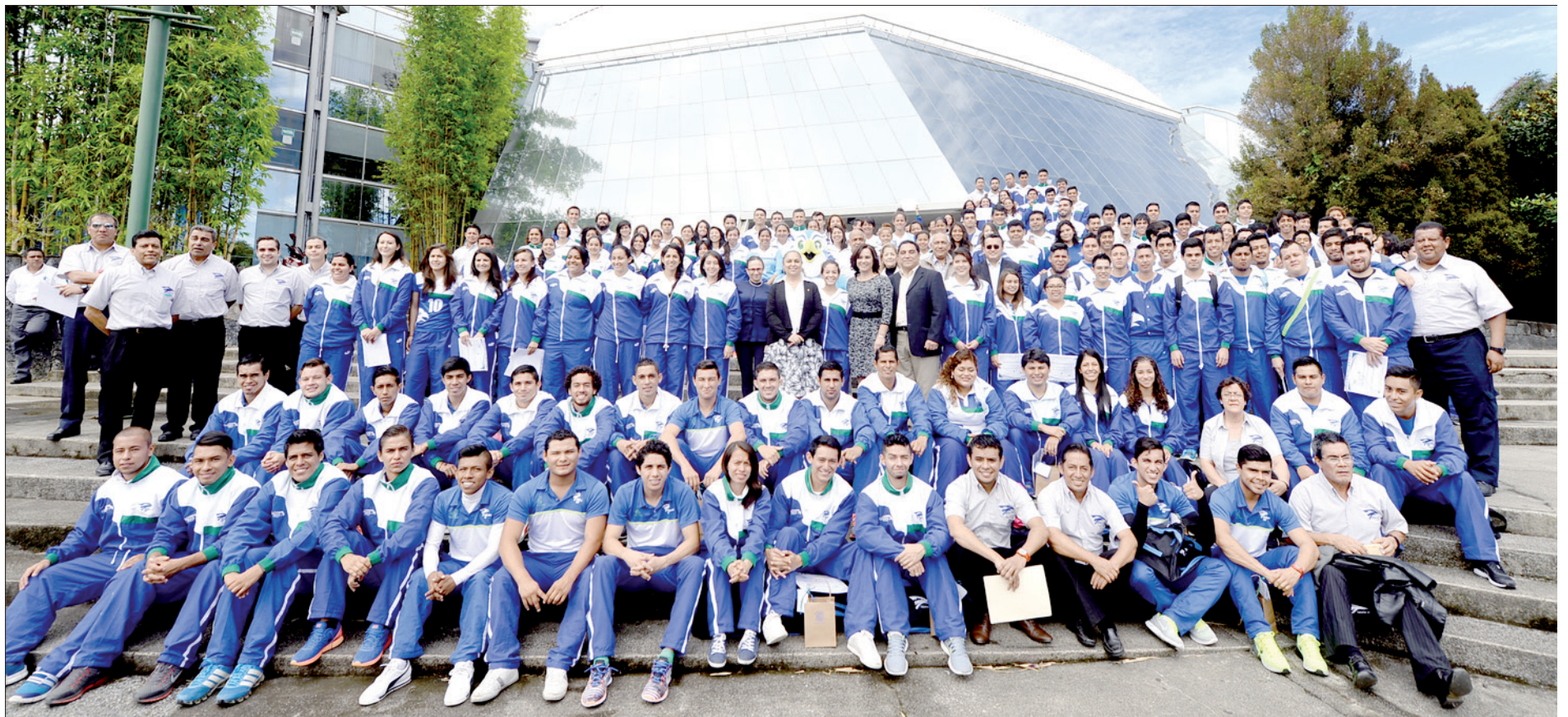
Un total de 174 estudiantes destacaron en la Universiada Nacional Nuevo León 2015

“ Toda mi vida he sido deportista, incluso fui competidor y siempre me ha gustado el deporte; conocí esta disciplina en 2004 y me gustó mucho, me apasionó y empecé a tomar cursos de juez y de entrenamiento y me atrajo el reto. Una motivación importante es trabajar con los jóvenes porque te contagian su energía, esto fue lo que hizo que me aventara al ruedo, que enfrentara este reto de guiar al equipo”, detalló.