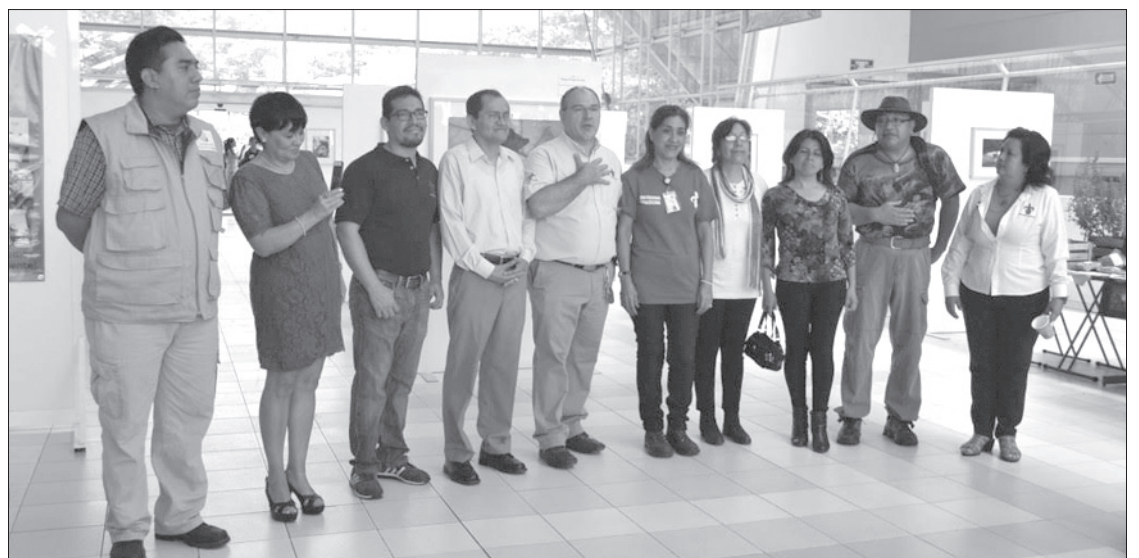
Coordinadores para la sustentabilidad de diferentes facultades durante la inauguración

Al respecto, es importante destacar que la sustentabilidad es un proceso complejo de varias dimensiones: ambiental, económica, social e incluso espiritual. La democracia, la justicia, la ética, el manejo integrado de recursos, la salud, el