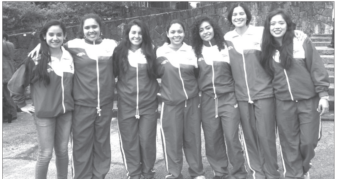
La Selección Femenil, lista para encarar la Temporada 2015-2016