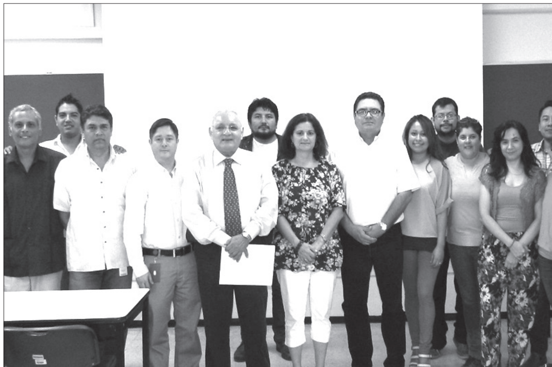
Autoridades universitarias con los representantes de la Coordinación de la Unidad de Género