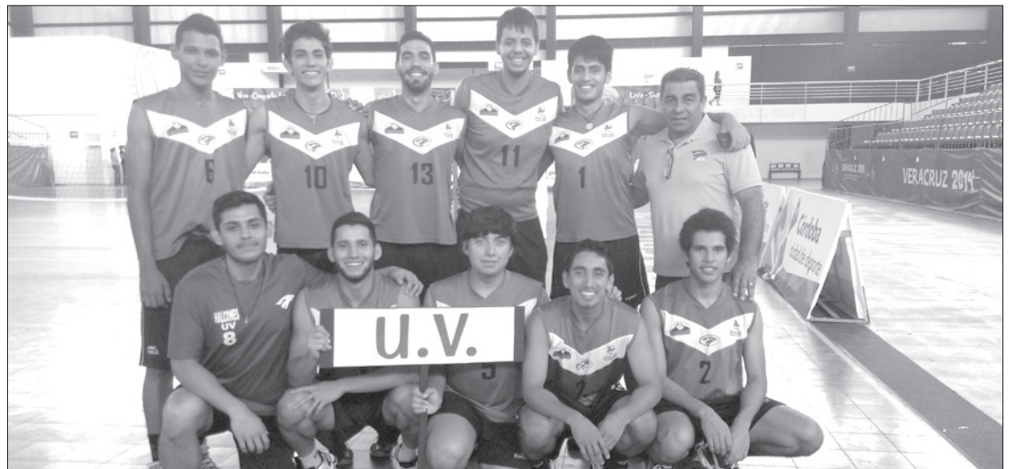
El torneo sirvió de preparación para el conjunto universitario

El evento sirvió de preparación para el conjunto emplumado, que se alista para competir en el Festival Deportivo Estatal de la UV, que se llevará a cabo en septiembre.